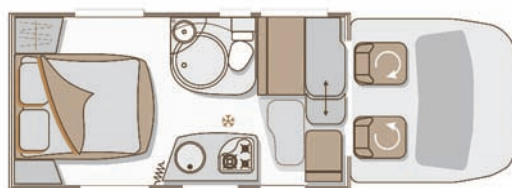
Genesis + 42 Semintegrale