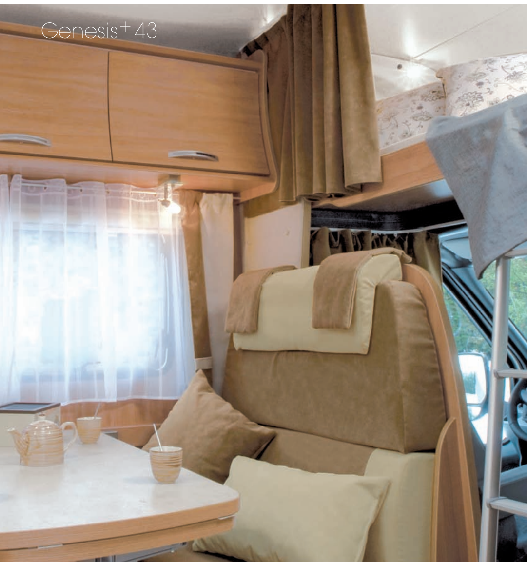
Genesis + 43